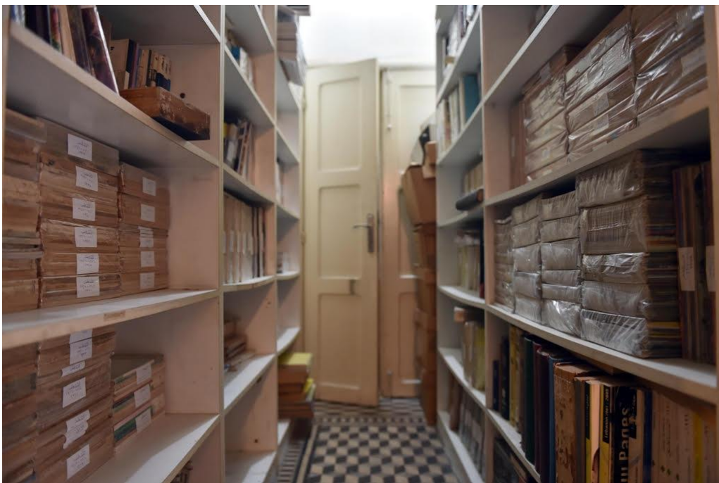
Des archives entreposées dans les locaux de l'ONG à Haret Hreik.

Umam est donc un centre de documentation visant à réunir des archives de tous supports portant sur l'histoire du Liban contemporain en général et sur la période des guerres civiles en particulier : ouvrages, littérature grise, périodiques de tous horizons, photographies, cartes, archives familiales, documents institutionnels, sources iconographiques et vidéographiques, etc. Pour Lokman Slim, diverses problématiques s'entrecoupent dans l'effort de conservation, d'inventorisation et de communication mené par Umam : Qu'est ce qui fait que de tous temps au Liban, on empêche l'émergence d'une vie politique saine ? Comment expliquer que les guerres du Liban se sont "terminées" en 1990 ? Comment se