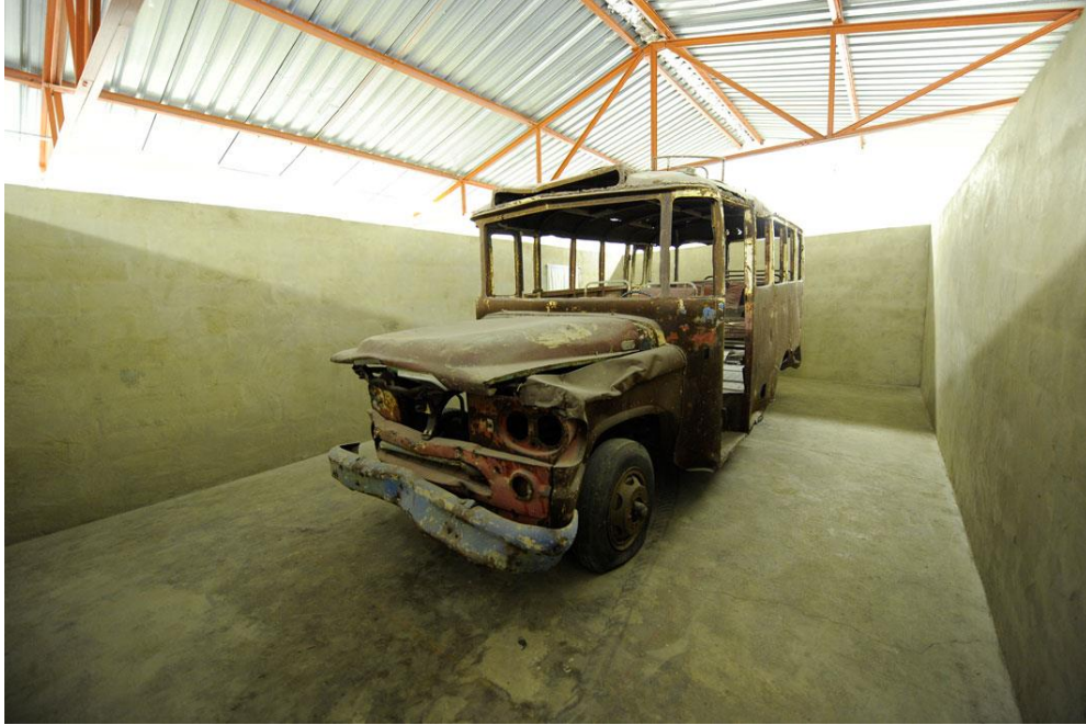
Bus dans lequel 27 personnes ont été assassinées à Aïn al-Remmaneh par des miliciens phalangistes le 13 avril 1975, date généralement retenue pour marquer le début des guerres civiles libanaises. Lieu : Le Hangar.