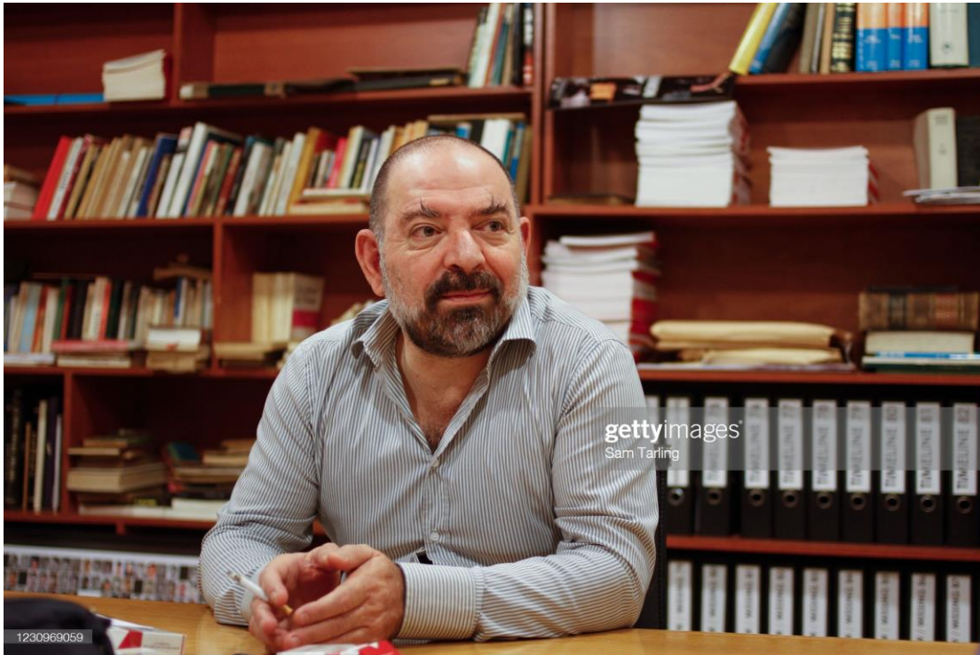
Lokman Slim interviewé au Hangar, Haret Hreik, le 03/09/2012

donnait in fine accès à tel ou tel fonds intéressant un chercheur ou une chercheuse, en fonction de la confiance et des affinités intellectuelles qu'il pouvait développer envers ce dernier ou cette dernière, ou bien dans le cadre d'un partage de documentation. Les demandes de consultation de la plupart des collections relatives aux archives à caractère sensible n'ont en effet rien à voir avec les procédures officielles (demandes de dérogation pour consultation notamment) que l'on peut par exemple rencontrer aux archives militaires de Vincennes ou aux archives diplomatiques de la Courneuve. Dans le cas d'Umam, il s'agissait jusqu'à présent de discussions informelles avec son directeur qui autorisait le chercheur ou la chercheuse à consulter la collection désirée ou ignorait sa requête. Si l'échange se déroulait conformément aux attentes du directeur d'Umam, ce dernier pouvait attirer l'attention de son interlocuteur sur l'importance d'un document, d'une personnalité, et proposait même, parfois, de consulter certains fonds originaux connus de lui seul.