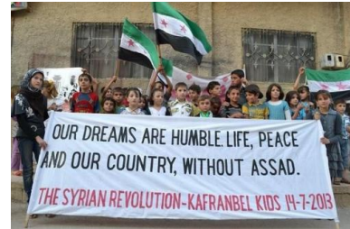
Habitant.e.s de Kafranbel, en Syrie, en 2013.

que tous les vendredis, ses habitant-e-s arboraient des pancartes remarquées pour leur franc-parler et leur créativité.