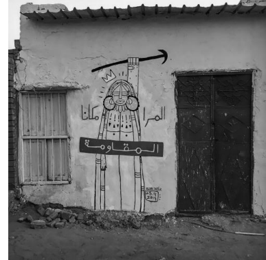
« La femme est le lieu de la résistance ». Œuvre d'Alaa Satir, au Soudan, le 23 avril 2019.

est frappant, et l'organisation du vivre-ensemble – se nourrir, se défendre, se soigner – participe de la capacité à résister à la répression.