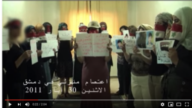
Extrait d'une manifestation de salon tournée dans un appartement privé à Damas, en Syrie, le 30 mai 2011.

vidéos ne sont ni les femmes au foyer traditionnelles, ni les femmes politiquement engagées dans l'arène publique.