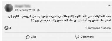
Un post annonçant la participation aux manifestations du 25 janvier 2011 en Égypte.

de mobilisation. Cela réduit aussi la réalité sociale, en donnant l'impression que les révolutionnaires sont tous issus de la classe moyenne.