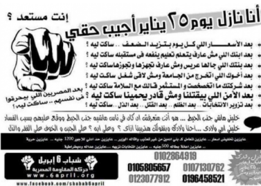
Tract imprimé et distribué par les jeunes du 6 Avril, à Alexandrie, à la veille du 25 janvier 2011.

Ce que disent les archives que nous avons étudiées, ce n'est donc pas le moment de bascule, où l'on en reste à des métaphores du type de la « goutte d'eau » de trop, mais comment cela monte, comment cela prend.