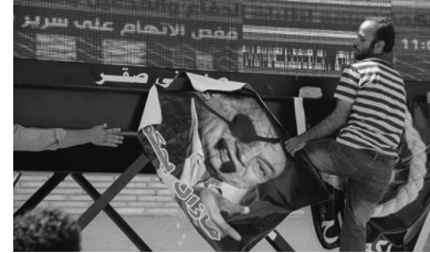
Détournement et raccrochage de portraits d'Hosni Moubarak : « Il règne encore », en novembre 2011 en Égypte.

ont ouvert des potentialités qui ne sont pas refermées et expliquent en partie la violence avec laquelle le pouvoir réagit aujourd'hui, par exemple en Égypte.