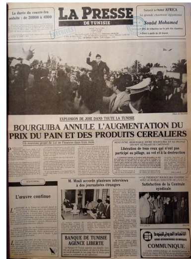
La Une du journal « La Presse de Tunisie », le 7 janvier 1984.

non plus d'expliquer le moment de la révolution, parce que cela fait longtemps qu'une bonne partie des jeunes n'avait pas de travail.