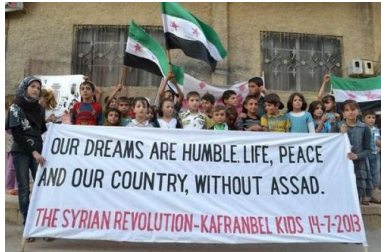
Habitant.e.s de Kafranbel (Syrie), en 2013.

PAR JOSEPH CONFAVREUX ARTICLE PUBLIÉ LE JEUDI 17 DÉCEMBRE 2020